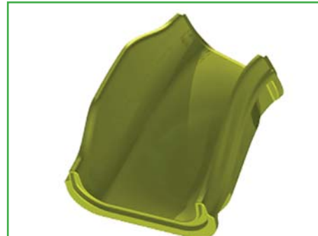
Modul E Kurve links Art. Nr. 360E