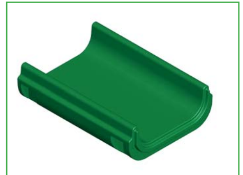
Modul C Mittelteil Art. Nr. 360C