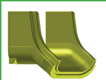
Modul A Einstieg Art. Nr. 360A