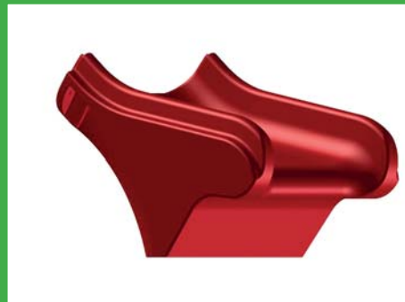
Modul D Auslauf Art. Nr. 360D