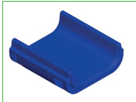
Modul B Mittelteil Art. Nr. 360B