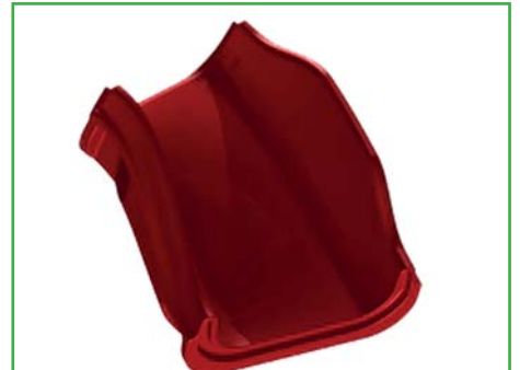
Modul F Kurve rechts Art. Nr. 360F